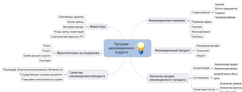
Рис. 1. Ментальная карта процесса продажи инновационного продукта *Построено автором

информации, ускорить разработку личных и бизнес-проектов [9]. Ментальная карта процесса продажи инновационного продукта представлена на рисунке 1.