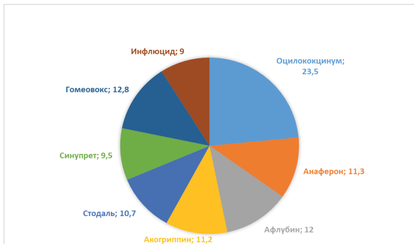
Рис. 3. Гомеопатические препараты, пользующиеся наибольшим спросом в аптечной сети

1990–1991 гг., вовлекло 300 и 372 пациента соответственно. В этом исследовании все участники были разделены на две однородные группы: основную, в которой использовался Оциллококцидум в качестве противовирусного средства, и контрольную, где применялось плацебо. Через 2 суток после начала приема Оциллококцидума у 43,7% пациентов отмечено значительное улучшение состояния, без ухудшения в любом клиническом случае. В контрольной группе с плацебо улучшение замечено у 33,5%, с ухудшением – у 5,4%. Дополнительно, результаты исследований, проведенных в России в период эпидемического подъема 2005–2008 гг. среди населения Москвы и Калуги, подтверждают хорошую переносимость и высокую эффективность Оциллококцидума. Эпидемиологическая эффективность, измеренная индексом эффективности (ИЭ) в 6,0 при показателе защищенности (ПЗ) 83,1%, свидетельствует о значительной эффективности препарата» [13].